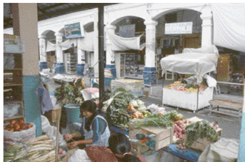
Reichhaltiges Angebot auf dem Wochenmarkt in Otavalo.