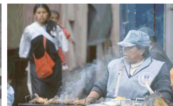
Leckereien auf dem Wochenmarkt in Otavalo