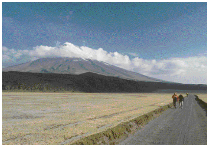
Der höchste freistehende Vulkan der Erde: der Cotopaxi

Und wir lernen die Bedeutung des Wortes „Regenwald“ kennen: Während eines Ausfluges werden wir vom tropischen Regen überrascht. Anstelle der Fortsetzung der Wanderung auf dem Landweg hätten wir hinsichtlich der Intensität des Regens auch direkt durch den Fluss