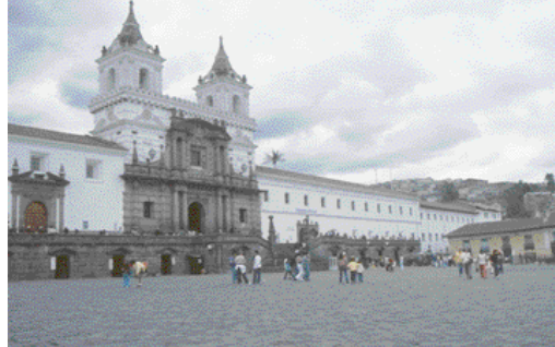
Die historische Altstadt Equadors: Quito Colonial und das Kloster San Francisco

schwimmen können. Spätestens jetzt hatte die Frisur den Kampf gegen die Naturgewalten endgültig verloren.