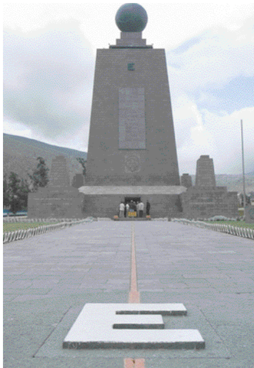
Eine durchgezogene Linie, wo die Kugel am dicksten ist: Am Äquator